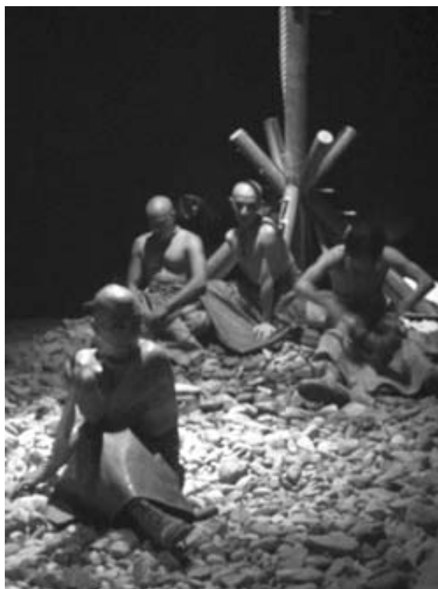
Obra: "La penúltima cena"