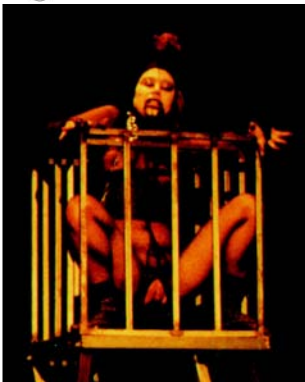
La Sucia. Obra: "Expulsado"