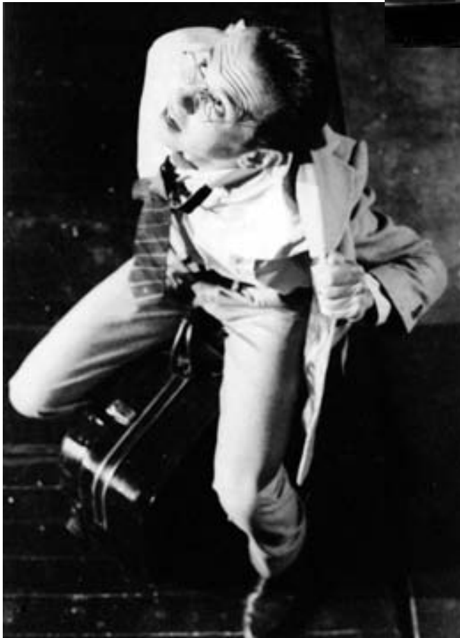
Agamenón. Obra: "Martillo"